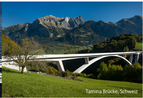
Tamina Brücke, Schweiz